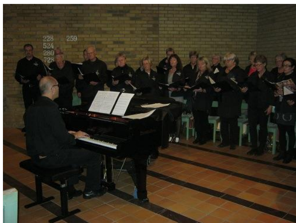
Brynolfskören sjunger i Stensjökyrkan.

Till detta stora sammanhängande område kom ett annat mycket stort och sammanhängande område, nämligen fyra gårdar i Krokslätt. Denna by bestod av fyra hemman. Följaktligen bör hela byn ha tillhört Biskopsbo. Därmed har vi ett sammanhängande område på västra sidan av Mölndalsån från Lackarebäcksbros i söder och nästan ända fram till Korsvägen i norr. (Halva Krokslätt by låg i Örgryte socken, norr om vår gräns.) Slutligen har vi en gård i Toltorp och Sulotorp (möjligen en felskrivning för Bunketorp).