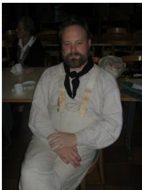
Nu har både jacka och mössa tagits av.

Gustavianer, håller föredrag om båtsmännen och klär sig då i sjömanskläder. Hans förening åskådliggör historien på många sätt, bland annat därigenom att medlemmarna syr upp klädesplagg från den tiden. Iklädda tidstypiska kläder exercerar man, dansar man eller lever man lägerliv ungefär så som det kan ha gått till under flydda tider.