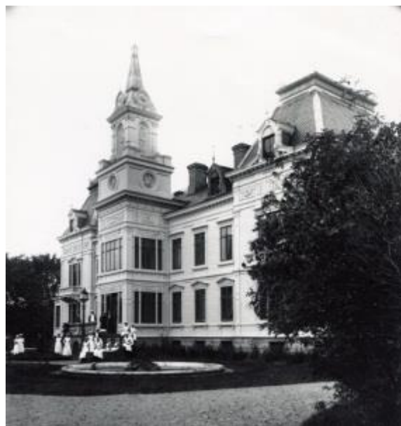
Wendelsbergs huvudbyggnad före ombyggnaden.