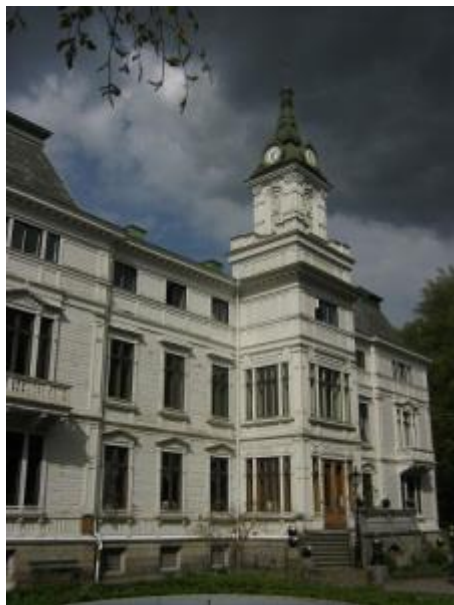
Wendelsberg i våra dagar. År 1932-1934 byggdes palatset om. Man höjde taket och inredde elevrum i vindsvåningen.

För mig som Mölndalsbo har Wendelsberg alltifrån min barndom varit ett uppskattat utflyktsmål. Wendelsberg ligger i Mölnlycke (Råda socken), och numera finns utmärkta cykelvägar mellan Mölndal och Mölnlycke. De går mycket naturskönt utefter Stensjön och Rådasjön. När man kommer till Wendelsberg, har man dels själva palatset, då kallat villa, nu