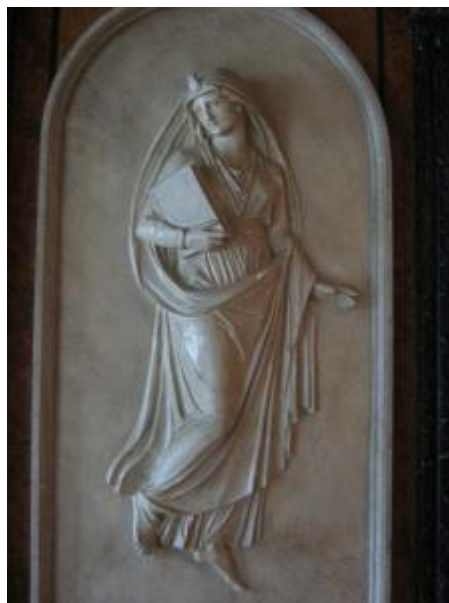
I hörsalen finns flera vackra reliefer, bland andra denna, som visar teologin, en kvinna med en bok (sannolikt bibeln) under armen och den helige Andes låga över huvudet.