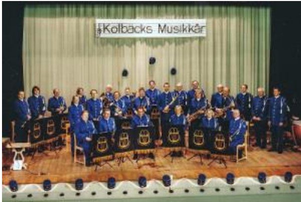
Kolbäcks Musikkår i Linneabion 2005.