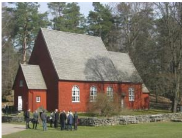
Föreningen för Västgötalitteratur höll sitt årsmöte i Ramnakyrkan, Kinnarumma gamla kyrka.

På den tiden, då tågen ännu stannade vid Mölndals Övre station, tog min far ibland med mig till Borås. Där tittade vi på det mesta, som då fanns att se, men Borås