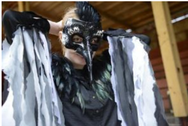
Ett av de många naturväsendena i skådespelet.

Dräkterna är utmärkta. Ljudaborg har i många år spelat teaterstycken med medeltida ämne. Föreningen eller medlemmarna har därför många medeltidsdräkter. Ronja Rövardotter har spelats in som film. Jag har endast sett några få filmsekvenser, men jag minns ännu med obehag de ohistoriska och osannolika dräkterna. Här på Ljudaborg känns allt (eller nästan allt) historiskt riktigt. Alla dräkter är dessutom vackra. När Astrid Lindgren (1907-2002) växte upp var naturen ännu, åtminstone bland ”de gamle”, besjälad, fylld av övernaturliga väsen. I sitt sagospel har hon tagit med sådana väsen: vildvittror, rumpnissar, grådvägar, småvittror och skogsväsen (besjälade träd). I folktron var dessa väsen oberäkneliga, lättstöta och ibland farliga. De speglar naturens farlighet.