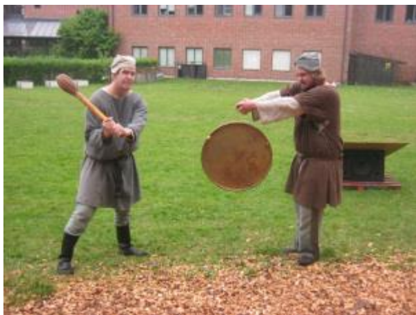
Ett par slag på gong-gongen blir ett skådespel av det mindre slaget.

Att åskådliggöra dessa farliga väsen på teaterns skådebanan är inte det lättaste, men Ljudaborg lyckas med allt. Dräkterna är uttrycksfulla. Genom sitt uppträdande lyckas dessa väsen förmedla en känsla av fientlighet och farlighet. Ljudaborg lyckades mycket bra åskådliggöra hur dimma i skogen omger Ronja och Birk, förvirrar dem och bringar dem i fara att komma vilse. Skogsväsendena håller upp vita lakan och tränger sig in på Ronja och Birk från alla