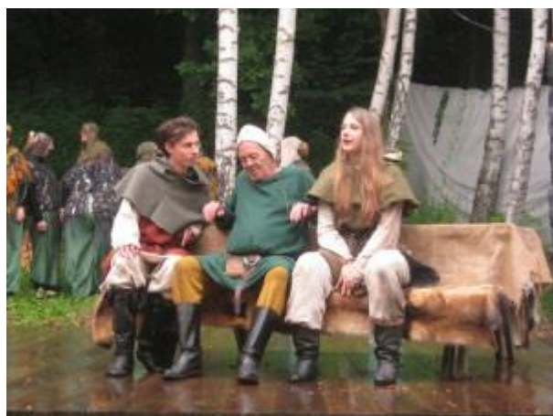
Birk, Skalle-Per och Ronja, tre framstående skådespelare med bra samspel.